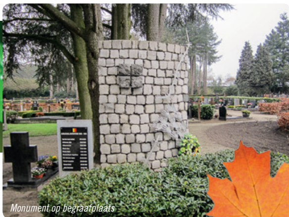
Monument op begraafplaats

De wandelaar die nog even de tijd wil nemen kan zich nog naar de begraafplaats begeven in de Schoolstraat. Daar staat een monument ter ere van de overleden 'Jonge Strijders' van de oorlog 1940-45 met daarbij een gedenksteen van de overledenen. Het beeldhouwwerk is van de hand van de plaatselijke kunstenaar A. Proost.