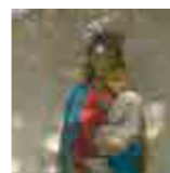
kapel Onze-Lieve-Vrouw van Den Haan Sjauwel

1960 op haar eigendom bouwen. Op de ingemetselde steen in de kapel lezen we: '8 mei 1960 mevr. Pannier-Groffi'. Pastoor Dox trok na het lot met talrijke parochianen op 8 mei naar de kapel, waar het beeld werd gewijd. Bij het overlijden van mevrouw Pannier werd de kapel aan de kerk geschonken.