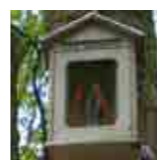
kapel Onze-Lieve-Vrouw van Gratie Jagersdreef-gemeentebos