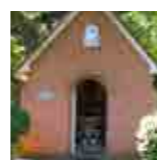
kapel Onze-Lieve-Vrouw Koningin van de Rozenkrans Achterste Hoeven

De Heemkundige Kring nam in de jaren '80 het initiatief om het kapelletje aan de Jagersdreef terug te plaatsen. De kapel was in zijn glorie hersteld tegen mei 1984. Het beeldje van Onze-Lieve-Vrouw van Gratie werd door de Heemkundige Kring gekocht en op 15 mei werd de kapel door de pastoor ingewijd. De Heemkundige Kring zorgt nog steeds voor het jaarlijks onderhoud.