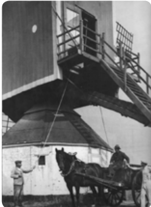
Molen In Stormen Sterk"

Verder wandelend naar 69 bereiken we nu de Beersebaan die we rechtdoor oversteken. Na +- 250 m bereiken we de Molenstraat. Hier ligt aan onze rechterzijde het molenveld met de in 2014 gerestaureerde en heropende molen "In Stormen Sterk". De naam verwijst naar het feit dat deze molen, de eerder genoemde storm in 1940, wel weerstond. Hij had ook wel schade opgelopen aan de wieken maar is toen hersteld. Op deze plaats staan