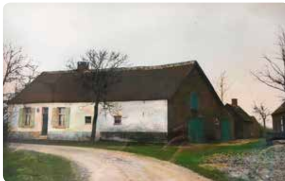
Rosmolen Waterlaat

We wandelen nu verder naar 69 en verder langs 68, 65 en 67 en komen zo terug aan ons startpunt.