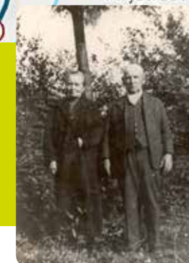
Molenaar molen Middelveld