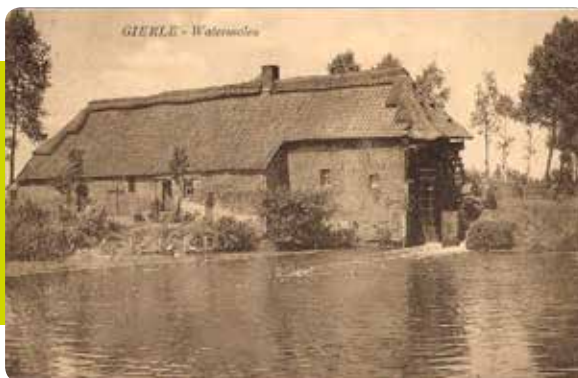
Watermolen "Gierle" oude postkaart

We wandelen verder via 2, 7, 6, 4, 66 en 69. Tussen deze laatste 2 knopen kruisen we de Molenpad. Hier 150m links was de nieuwe standplaats van de molen na de verkoop in 1911. De molen heeft hier nog gestaan tot