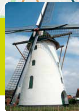
Molen In Stormen Sterk, standaardmolen